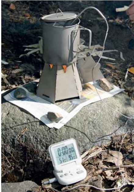
Keittotesti on käynnissä, ja anturi mittaa tarkasti veden lämpötilaa.

Mittasimme kuinka kauan puolen litran vesimäärän kiehattaminen kestää. Sellainen määrä on hyvin yleinen retkiruokaa tai kuumaa juomaa laitettaessa.