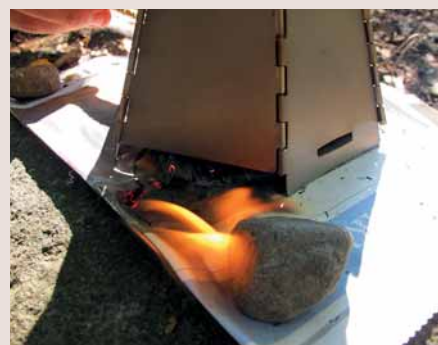
Vargo sytytti pohjapaperin tuleen.

Jokaisen risukeittimen alla pidettiin sanomalehden palaa, joka tarkastettiin heti vedenkeiton jälkeen.